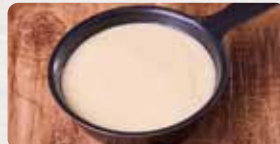
チーズフォンデュソース