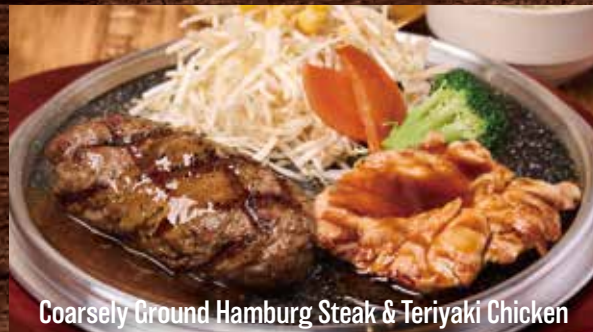
Coarsely Ground Hamburg Steak & Teriyaki Chicken