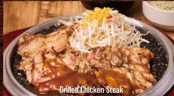
Grilled Chicken Steak