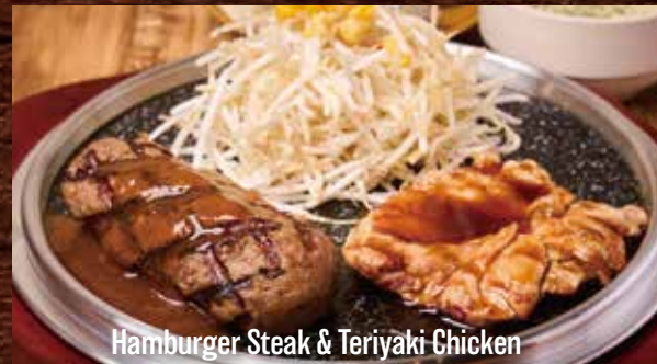
Hamburger Steak & Teriyaki Chicken